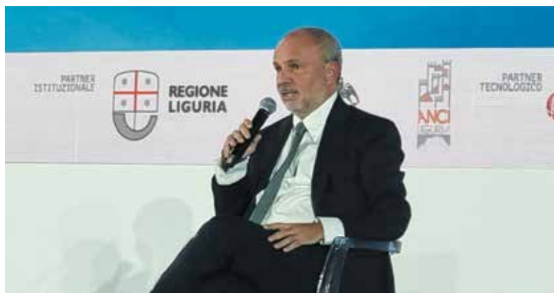
Il Prof. Orazio Schillaci, Ministro della Salute a Genova

Non è un caso che, negli ultimi anni, l'OMCeO della Provincia di Genova abbia lavorato moltissimo sul fronte istituzionale e la presenza del Ministro On. Prof. Orazio Schillaci (a distanza di alcuni anni dalla precedente visita dell'allora Ministro On. Beatrice Lorenzin), presso la nostra Sede, per oltre 3 ore, a fine ottobre, ne testimonia il successo non solo su scala locale e Regionale, ma anche nazionale.