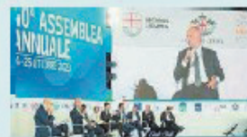
L'intervento di Schillaci

La carenza dei medici di famiglia, gli organici sempre più tirati degli ospedali, la crisi dei pronto soccorso, i medici a gettone e i posti nelle scuole di specialità. Tutti problemi, in qualche caso emergenze, che l'Ordine dei medici di Genova ha posto al ministro della Salute Orazio Schillaci durante l'incontro, riservato, di ieri pomeriggio con il presidente Alessandro Bonsignore, il numero uno degli odontoiatri liguri Massimo Gaggero e quasi tutti i consiglieri, oltre al genovese Matteo Rosso, responsabile na-