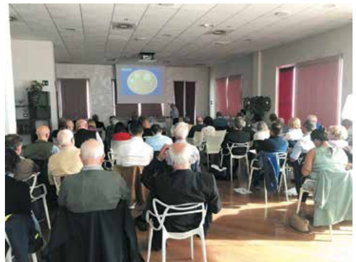
La numerosa platea di Odontoiatri e Medici