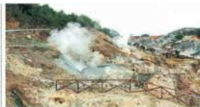
Fuoriuscita di vapore geotermico a Montecatini Terme, Toscana

sta fonte energetica», è la sintesi di Bruno Della Vedova, presidente dell'Unione geotermica italiana, Ugi. Alla geotermia, tecnologia che usa l'energia termica del sottosuolo per produrre corrente o per riscaldare e raffreddare gli edifici, era dedicato il convegno di Confprofessioni organizzato ieri a Genova. L'ospite più atteso, il ministro per l'Ambiente e la Sicurezza Energetica Gilberto Pichetto Fratin, ha ribadito l'interesse del governo ma non ha promesso una nuova legge più semplice né un organismo nazionale che promuova il settore. Il geotermico italiano copre oggi circa il 2% del fabbisogno energetico nazionale, e proviene da 36 centrali tutte in Toscana. «Ci sono altri 43 progetti di centrali fermi in attesa del via libera. In media, dalla presentazione del progetto alla produzione