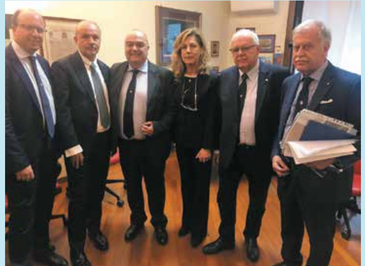
L'Esecutivo dell'Ordine con il Ministro Schillaci

Durante i colloqui in cui si è parlato di questi importanti aspetti e delle problematiche dei Medici, abbiamo affrontato anche alcuni aspetti dell'Odontoiatria in particolare quello rela-