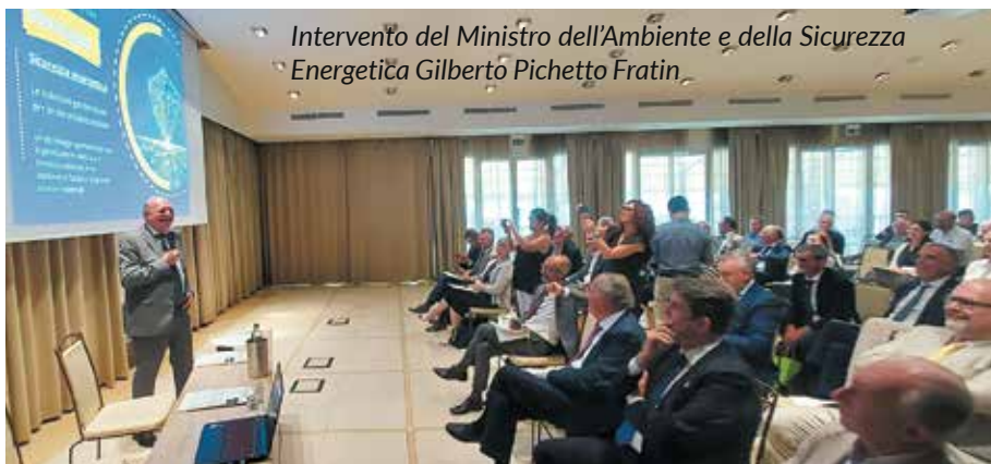
Intervento del Ministro dell'Ambiente e della Sicurezza Energetica Gilberto Pichetto Fratin