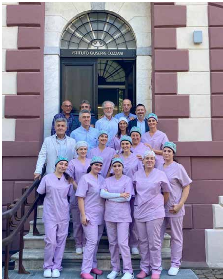
Docenti e discenti del Secondo Corso ASO della Spezia

A conclusione della formazione, le aspiranti ASO, hanno acquisito competenze, abilità e soprattutto una qualifica molto richiesta in ambito sanitario, in grado di assicurare un'occupazione stabile per il supporto alla professione del dentista, in continua crescita e innovazione.