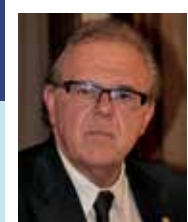
Presidente Albo Odontoiatri Ordine di Genova