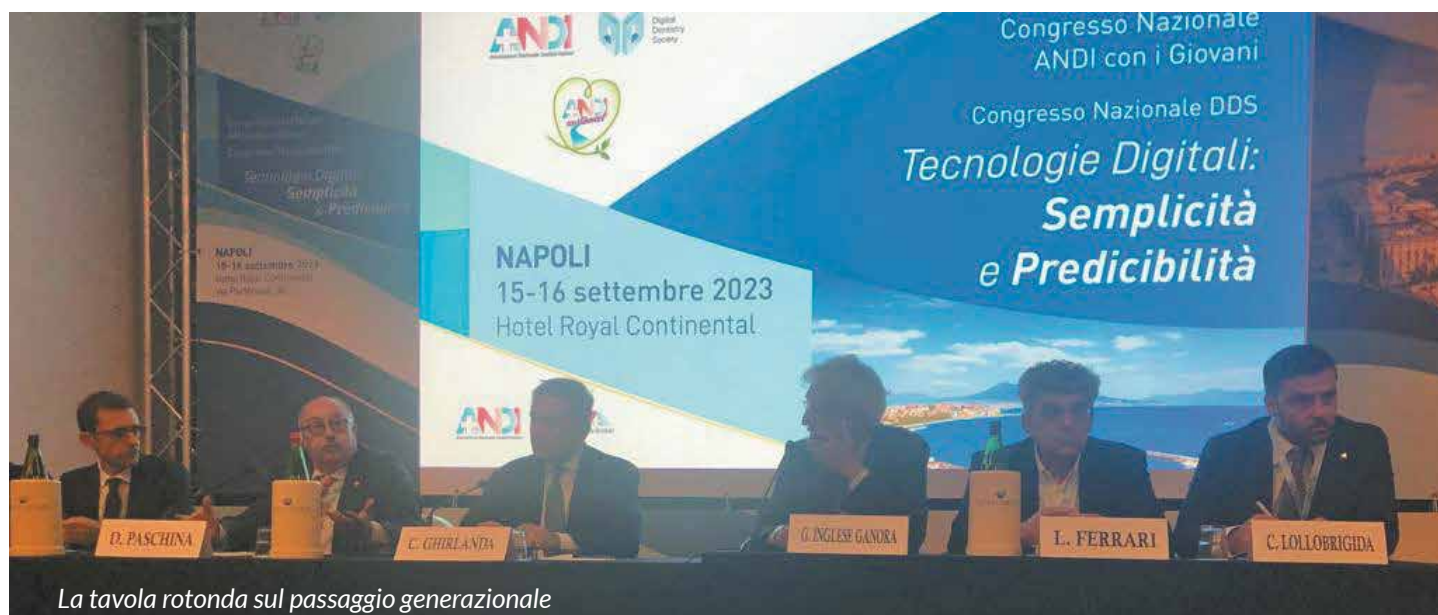
La tavola rotonda sul passaggio generazionale

Cultura, Innovazione, Sindacato dei Giovani e per i Giovani: si può così riassumere l’evento di Napoli, all’insegna di una Associazione moderna e sempre al passo con i tempi.