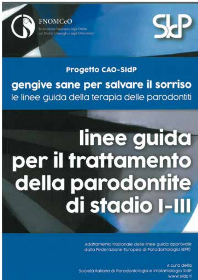
Lopuscolo del Progetto CAO-SIdP distribuito a tutti discenti

Sono 30 milioni gli italiani con un'inflammatione più o meno grave delle gengive, ma solo il 17% dichiara di aver ricevuto diagnosi e appena il 3% si è sottoposto ad una terapia adeguata.