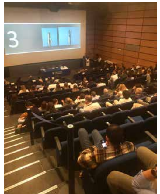
La platea del Congresso dell'Acquario di Genova